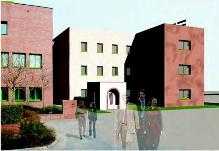
DER AUSGESCHNITTENE KUBUS NIMMT DAS BRUNNENHAUS AUF