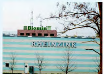
WERBESCHRIFTUNG, GRÖßERE SCHRIFT, NÄHER ZUR AUTOBAHN