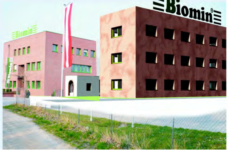
HAUPTGEBÄUDE, NEUBAU UND BRUNNENHAUS BILDEN EINE LINIE