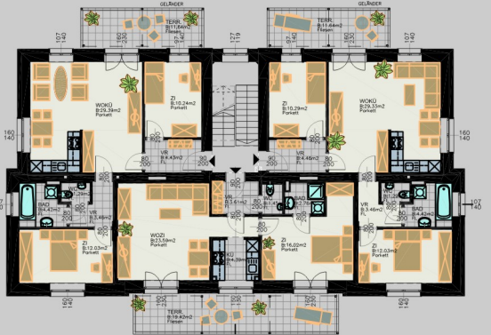
NACH UMBAU: 3 Wohnungen in EG, OG und DG