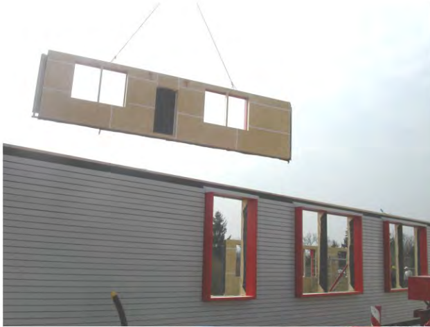
U2-6 Montage der Fertigteile

großformatige Wandelemente Deckenelemente Dachelemente sind vorgefertigt.