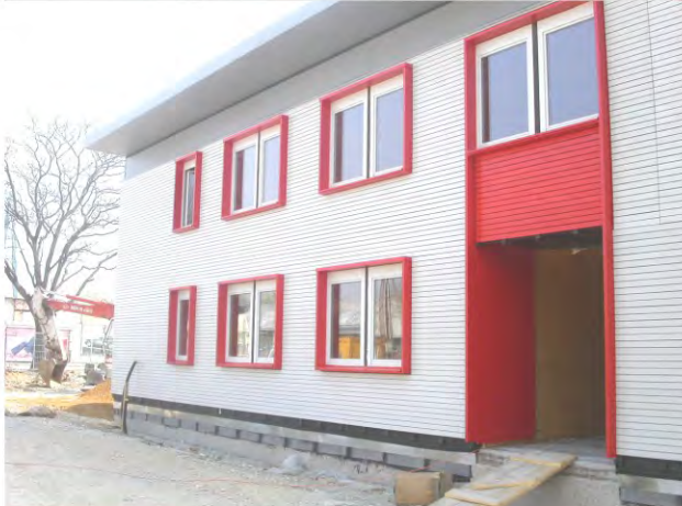
U2-6 kurz vor Fertigstellung

nach der geplanten Nutzungsdauer von 6-8 Jahren werden die Gebäuden an anderer Stelle wiederverwendet (ebenso U2-6, U2-8, U2-10)